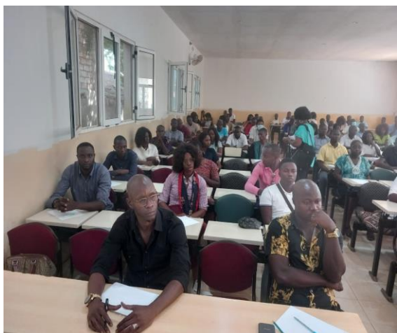
Sessão de realização de teste escrito no âmbito do Concurso nº01/2023.

Com os apoios vincados do AFRISTAT (Observatório Económico e Estatístico da África Subsariana), do Centro Estatístico da Comissão da UEMOA e do Ministério da Administração Pública, Trabalho, Emprego e Segurança Social, dos cerca de 50 (cinquenta) técnicos requeridos, foram recrutados 29 (vinte e nove) entre os cerca de 400 (quatrocentos) candidatos. Destes 29 (vinte e nove), 4 (quatro) são do sexo feminino (cerca de 14%). Os respetivos processos de integração estão em curso.