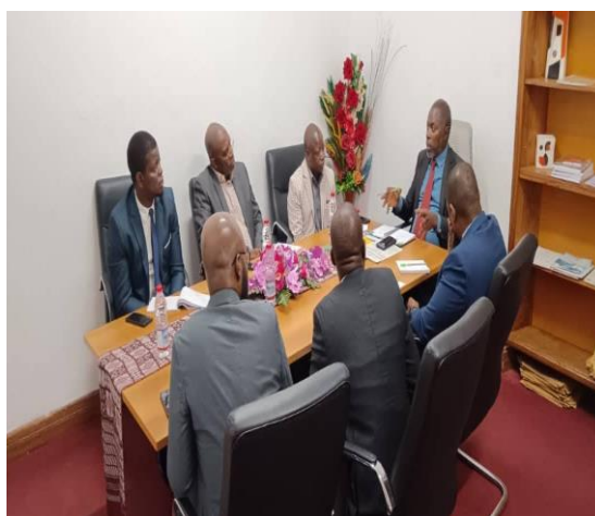
Missão conjunta UEMOA/AFRISTAT e Ministério da Administração Pública, Trabalho e Modernização do Estado