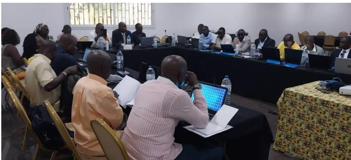
Fase I: Atelier de Contas Nacionais sobre Elaboração de Matriz da Contabilidade Social (MCS)