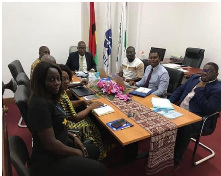
Missão de monitoramento financeiro ao INE Guiné-Bissau